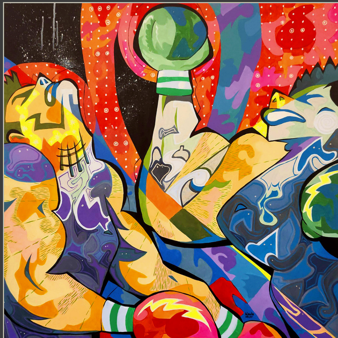
O CINTURÃO Acrílica e marcador sobre tela 100 x 100 cm 2023