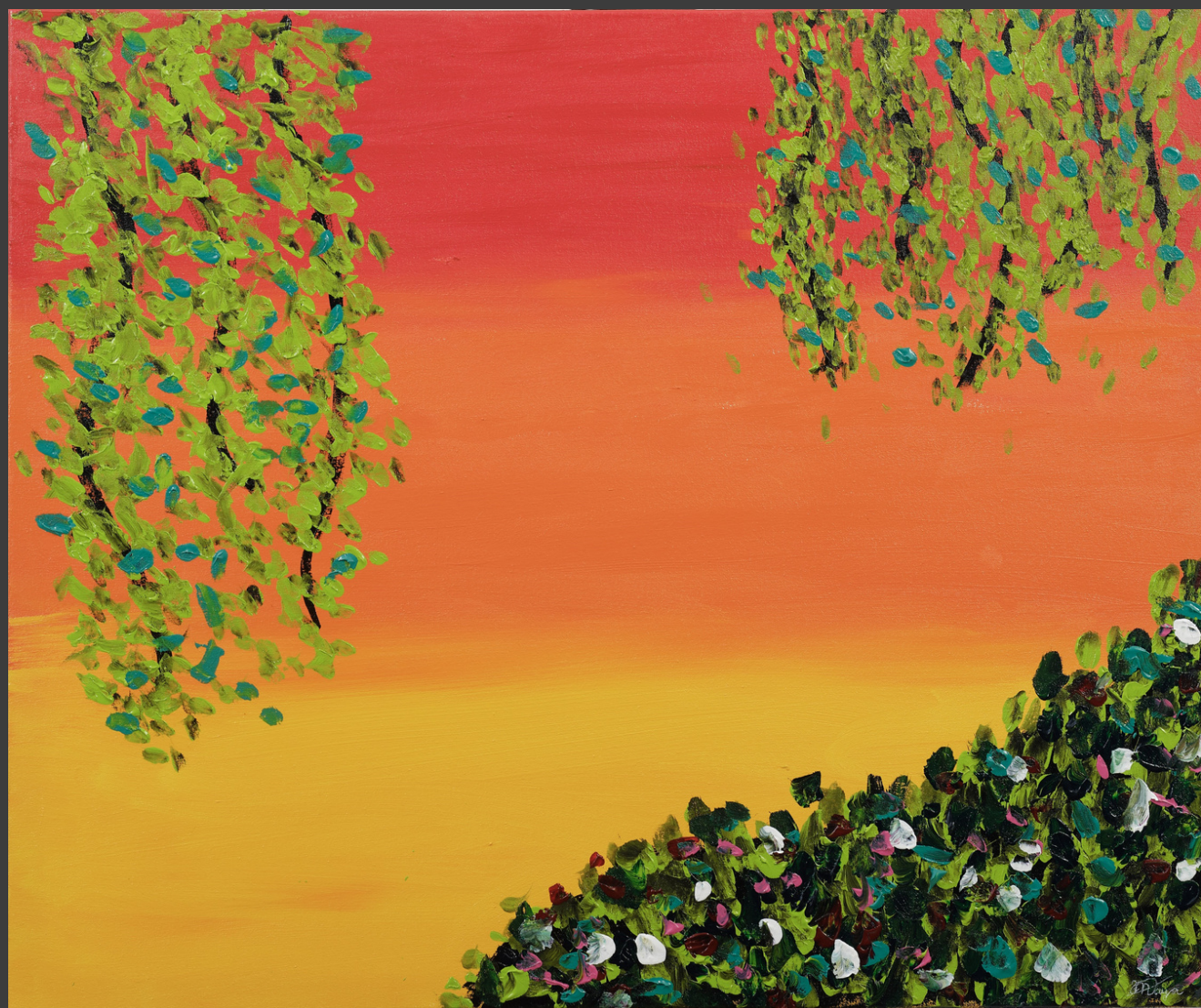
Série Doce Infância Acrílica sobre tela em impressão fine art 80 x 90 cm