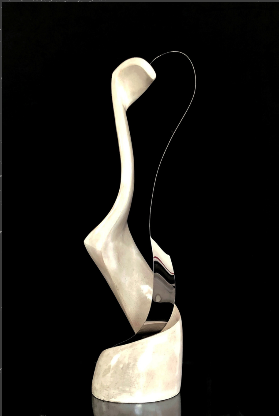
Encontro de linhas Parte esculpida em concreto celular com acabamento com processo de mármore com aço inox polido 0.93 x 0.29 x 0.23 cm.