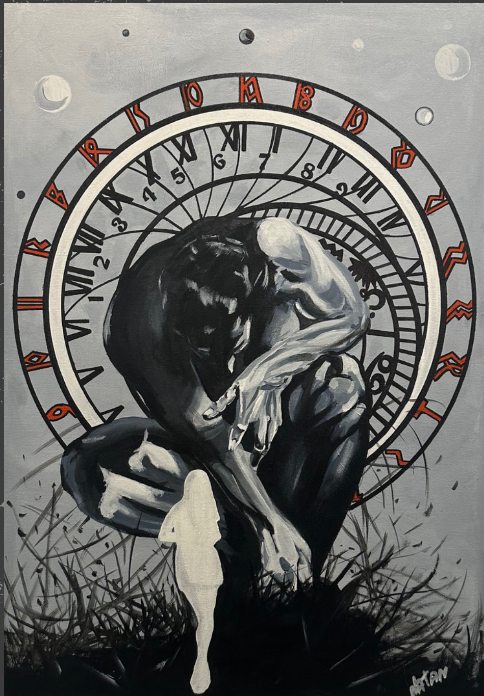
Série Surrealismo Acrílica sobre tela 60 x 80 cm