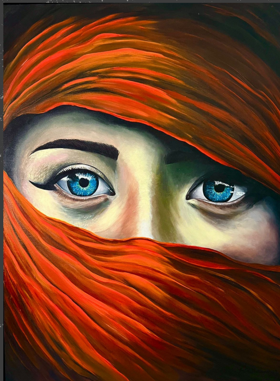
Olhar Azul Acrílica sobre tela 60 x 80 cm 2023