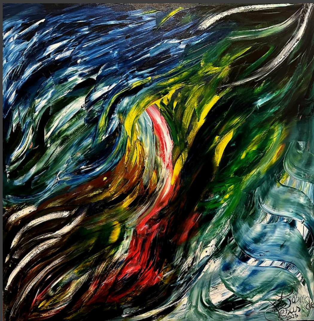
Elevo Óleo sobre tela 100 X 100 Cm