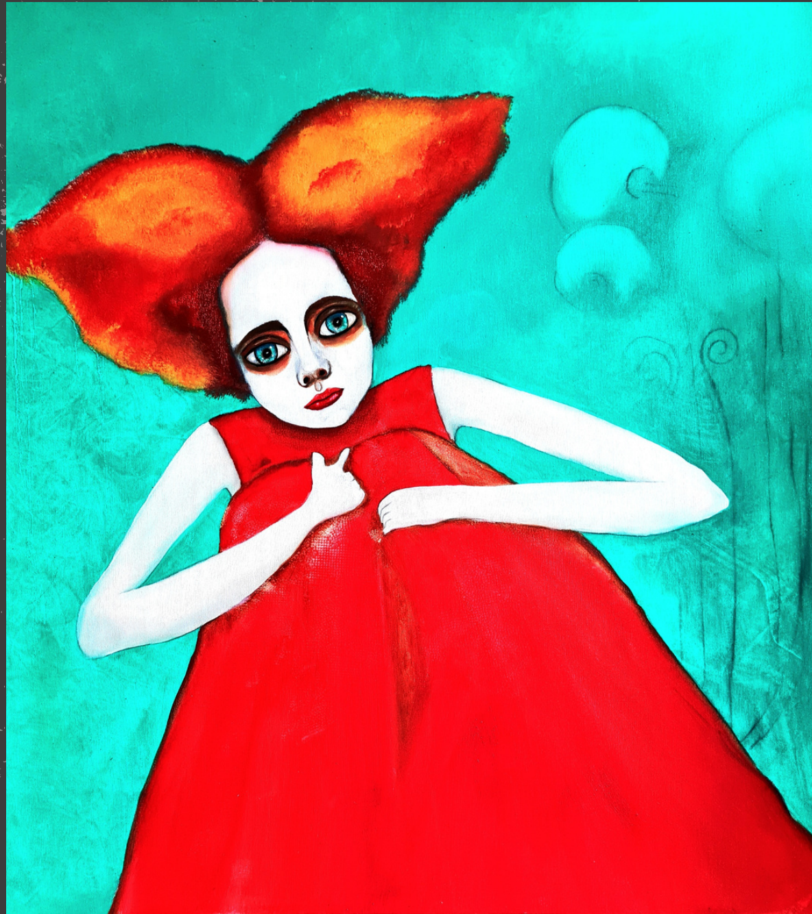
Selfie of a Soul Óleo sobre tela 80 x 80 cm 2023