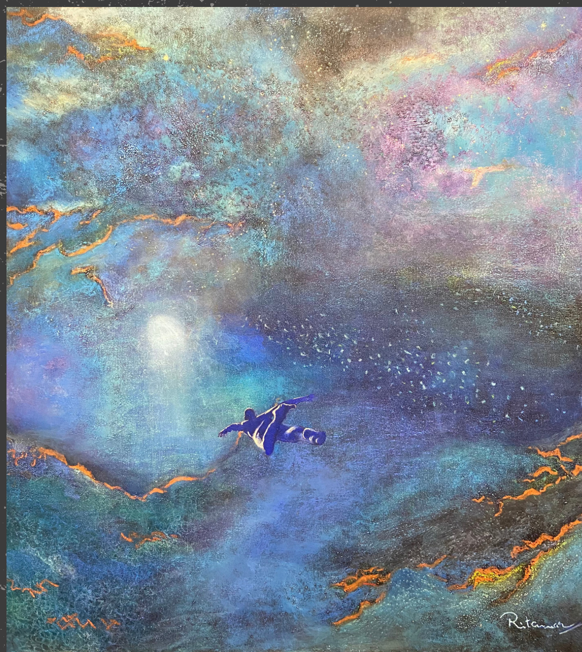
No Rumo Pastel a óleo, esfumatto, aquarela e veladura sobre fundo texturizado 90 x 100 cm