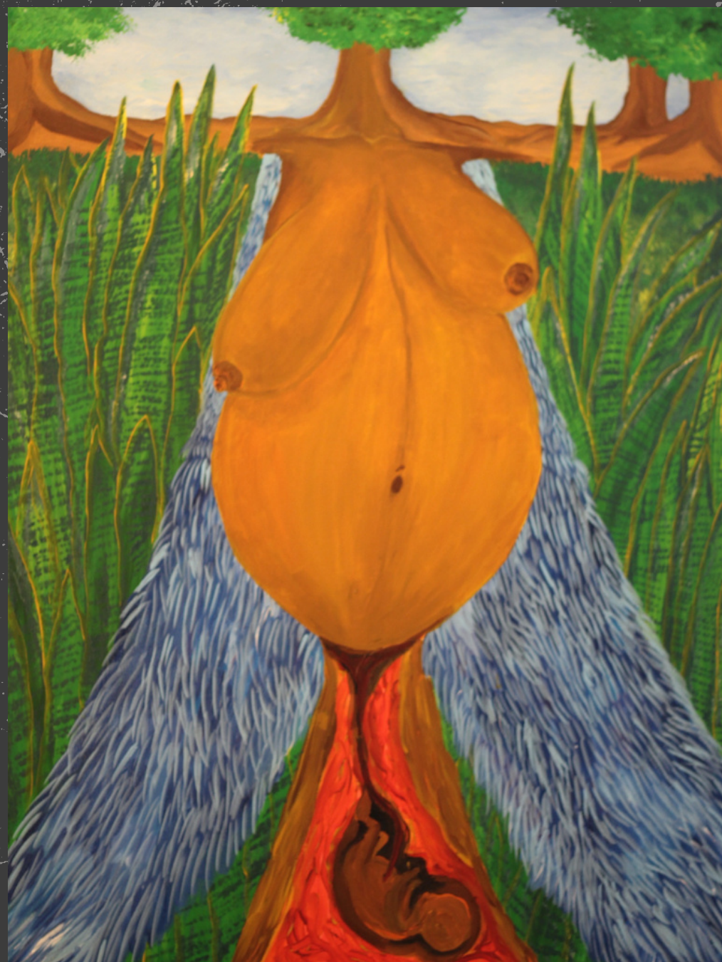
Birth Acrílica sobre tela 60 x 80 cm