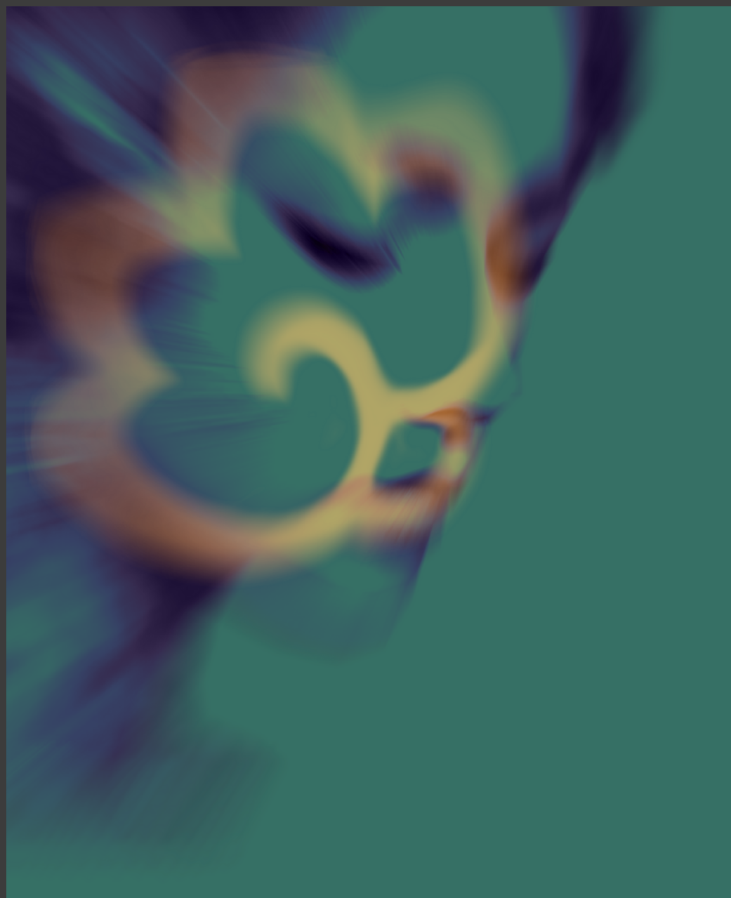
Cisne Arte Digital com impressão fine art 60 x 80 cm