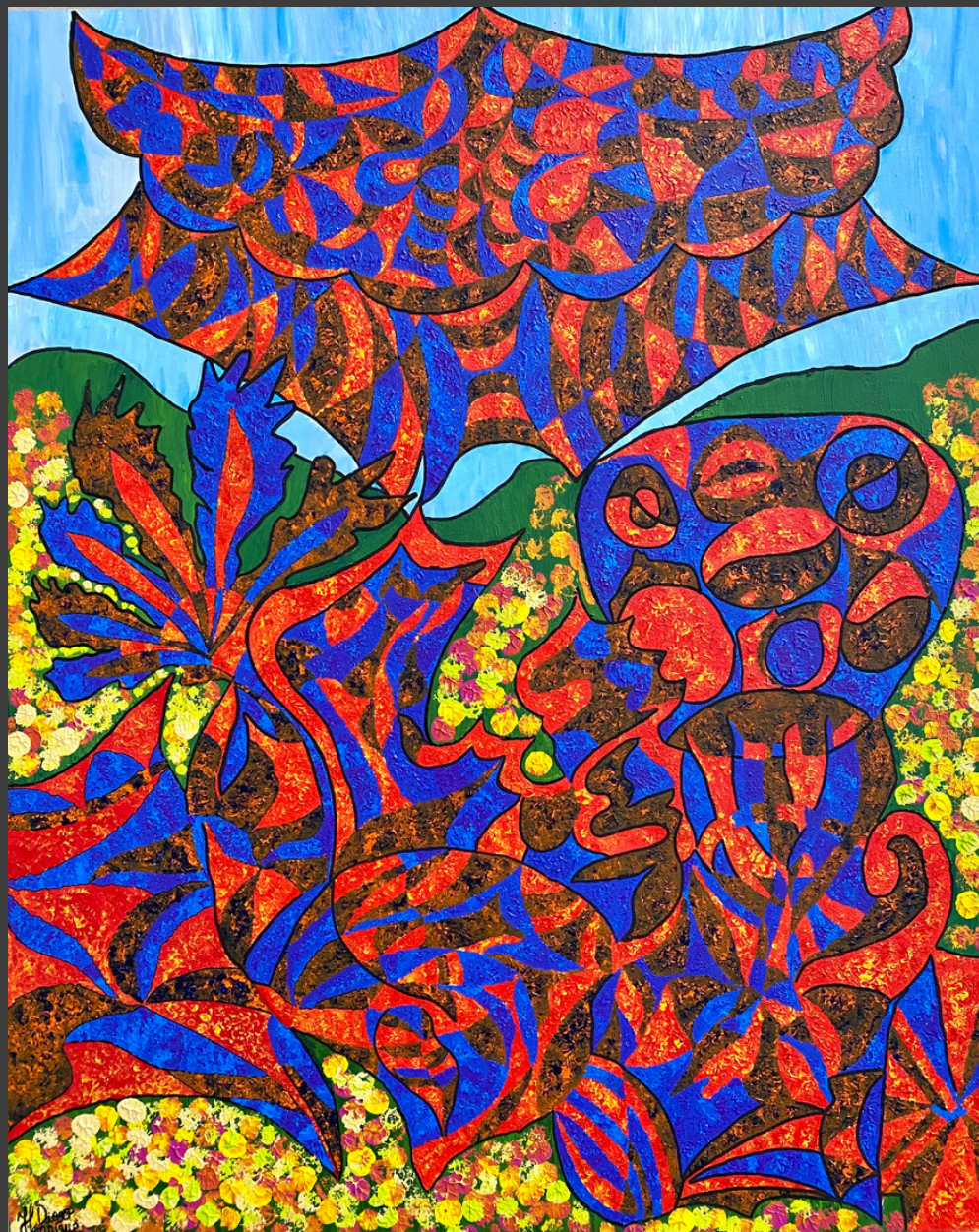
Metamorfose, Realidade Criada Acima dos Olhos. Acrílica sobre tela e marcador permanente 100cm x 80cm. 2023